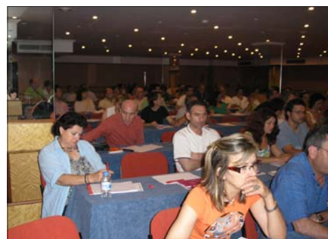
La jornada tengué una gran afluència de Delegades i Delegats de la UGT Balears.