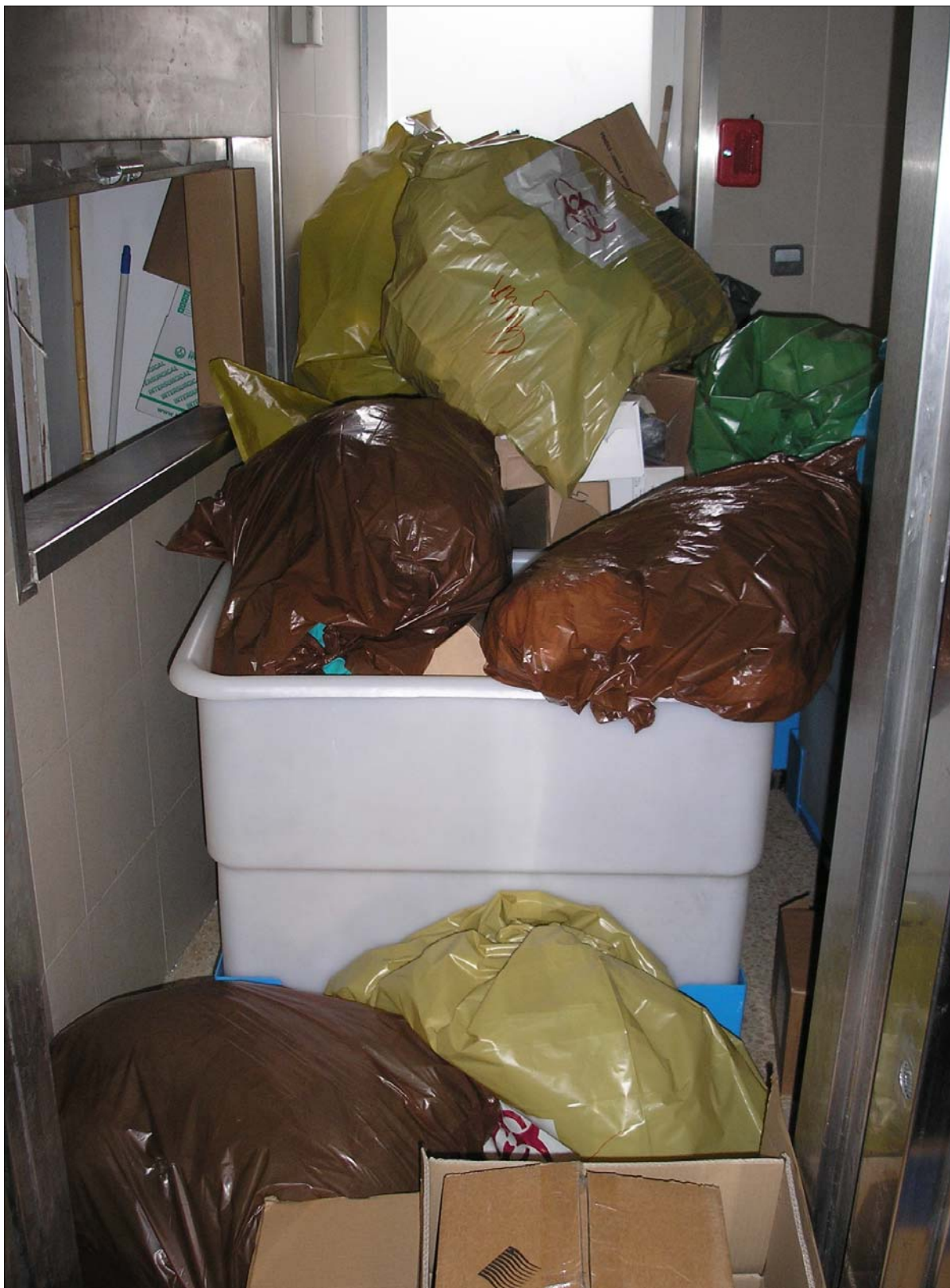
Acumulación de residuos en el Hospital Universitario de Son Dureta

así como de los comités con los servicios de prevención de las empresas contratadas y subcontratadas si fuera menester.