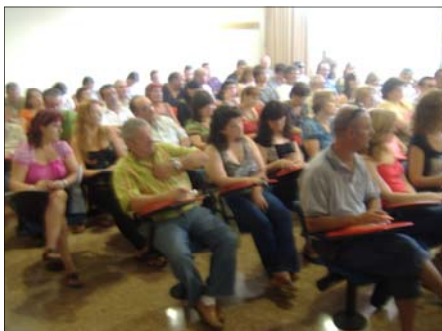
Els Delegats i Delegades de Prevenció que ompliren el Saló d'actes a Eivissa.

El passat dia 26 de juny, seguint la campanya sobre sensibilització en prevenció de riscos laborals de la UGT de les Illes Balears,