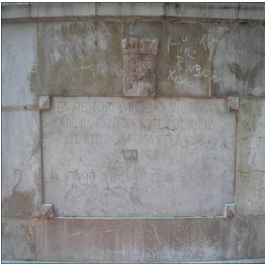
Placa commemorativa a les víctimes de l'accident.